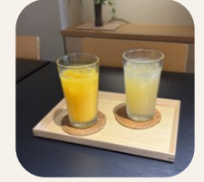
100%オレンジジュース 100%りんごジュース 400円