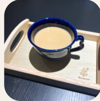
ホット・アイスカフェオレ M/450円 L/600円