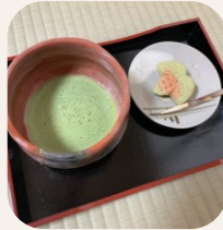
お抹茶セット(生菓子) 800円