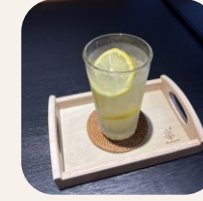
手作りレモンスカッシュ 500円