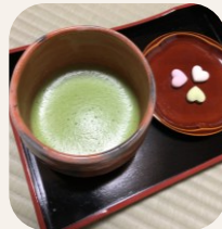
お抹茶セット(お干菓子) 550円 ★お干菓子 単品250円