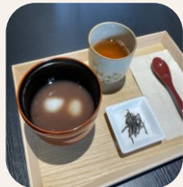
白玉ぜんざいセット 600円