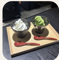
ソフトクリーム (バニラor抹茶) 500円