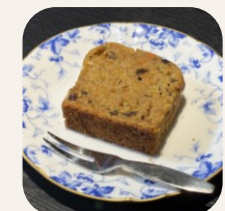
手作りケーキ(単品) 500円 ※日によって内容が変わります。