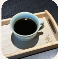
ホット・アイスコー M/400円 L/500円